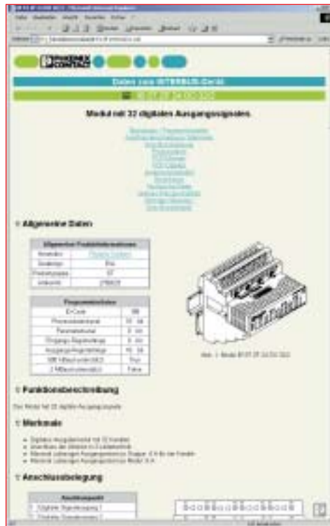
Abb. 3: Teilnehmerbeschreibung mittels ‚Style Sheet‘ im Browser dargestellt

Bereits während der Programmerstellung ermöglicht das integrierte Zielsystem einen umfangreichen Programmtest. Eine voll funktionsfähige Soft-SPS ermöglicht die Bearbeitung von über 1000 E/A-Punkten, die am Bildschirm