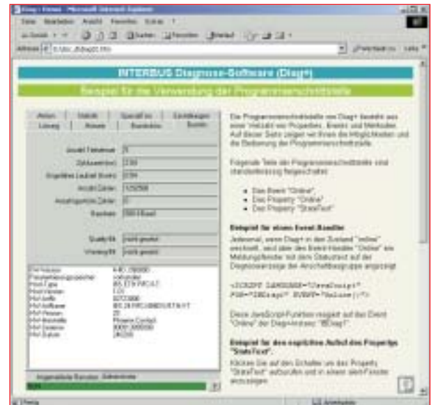
Abb. 1: „ActiveX-Control“ im Browser dargestellt